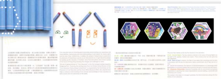
Presentation Pack inside