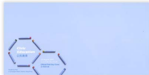
First Day Cover