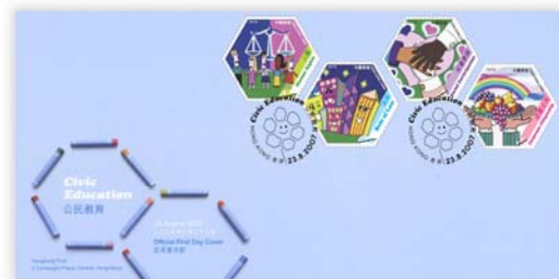
Serviced First Day Cover affixed with a set of 4 mint stamps